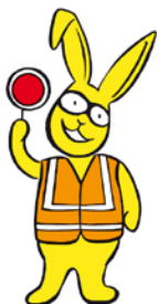
Leitung und Erhaltung